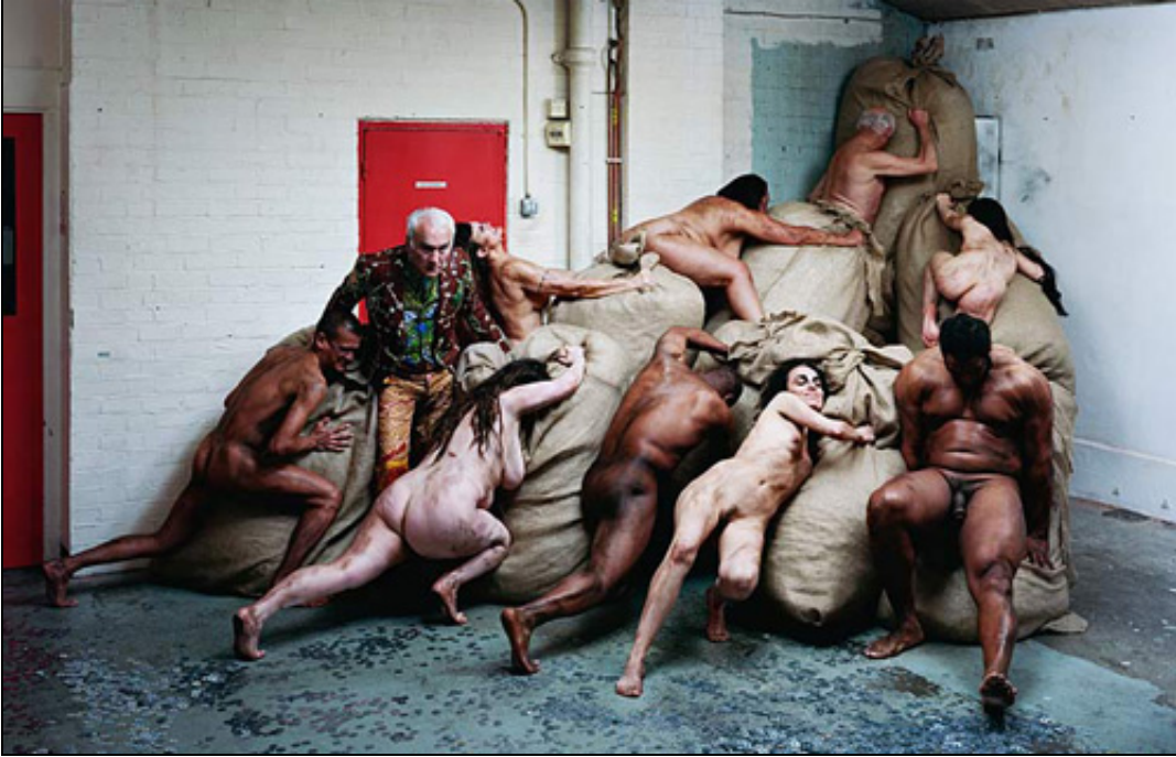
Yinka Shonibare. Willy Loman: The Rise and Fall (Avaricious and Prodigal). 2009

© Yinka Shonibare. Courtesy Stepjen Friedman gallery