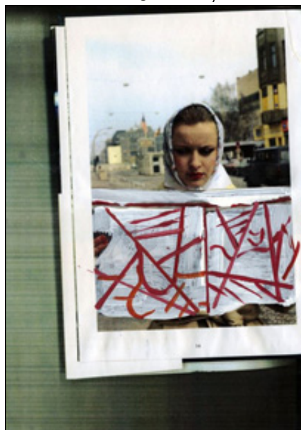
Paulina Oloswka. Head-Wig. Detail from collage. 2009

Прием на выставке современного портрета — двенадцать художников в разных техниках и медиа демонстрируют свое амбивалентное отношение к этому жанру. Обещаны «скандальность, истеричность и интимность», среди участников не обошлось, конечно, без Синди Шерман. Куратор и участница выставки — польская художница Паулина Оловска, которая в 19:30 проведет экскурсию. Автобус от Frieze в 17 часов.