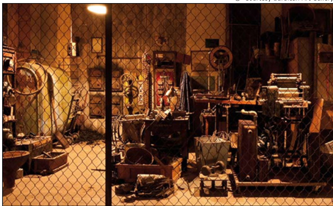
Robert Kusmirovski. Bunker

Для тех, кто Софи Каль уже видел, возможно, интереснее будет поехать сюда. Польский художник известен своими тщательно построенными инсталляциями — симуляциями исторических мест («Тотальные инсталляции» в духе Кабакова). Здесь он построил бункер времени Второй мировой войны. Художник также покажет перформанс. И еще в Barbican в этот вечер можно будет посмотреть выставку « Radical Nature: Art and Architecture for a Changing Planet. 1969—2009 ». Автобус сюда уйдет от Frieze в 18 часов.