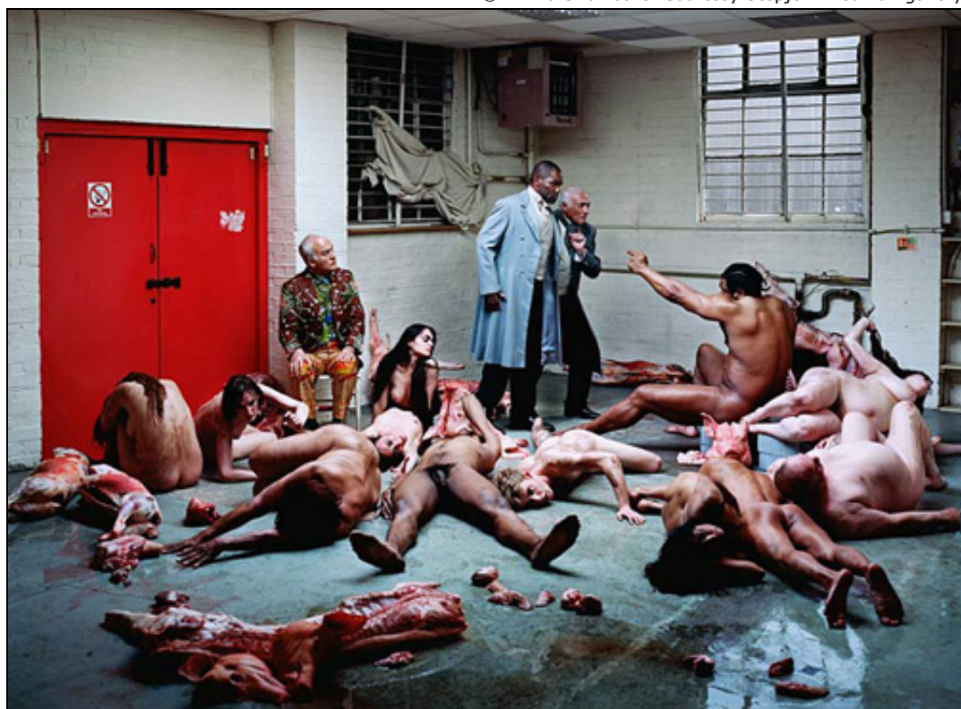
Yinka Shonibare. Willy Loman: The Rise and Fall (Gluttons) . 2009

© Yinka Shonibare. Courtesy Stephen Friedman gallery