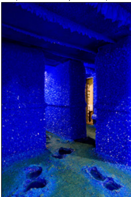
Roger Hiorns. Seizure . 2008

© A Jerwood/Artangel Commission Harper Road, London. Courtesy Corvi-Mora, London