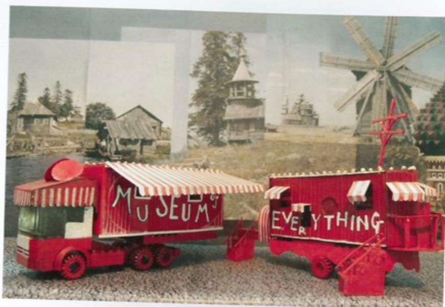
9 Model van het mobiele museum van The Museum of Everything dat in 2012 zo'n 3500 km door Rusland aflegde om op het spoor te komen van onbekende kunstenaars. Het einddoel was Moskou, waar een selectie van de ontdekkingen samen met eerder verzameld werk werd getoond in Exhibition #5.