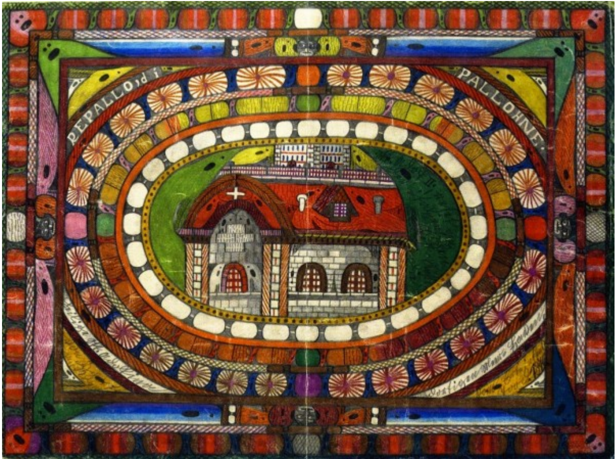
Adolf Wölfli (1864-1930) Bern, Switzerland