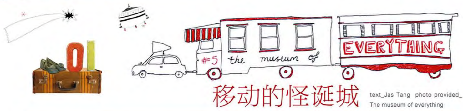
移动的怪诞城 text_Jas Tang