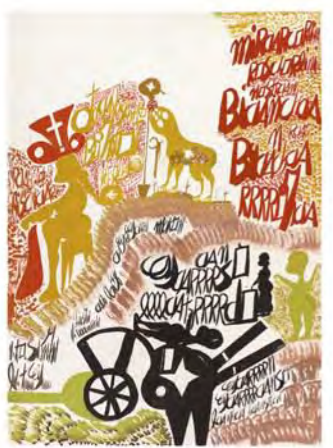
• MoE 在威尼斯艺术双年展展出的，是已故自学画家 Carlo Zinelli 的遗作

始创于 2010 年的 The Museum of Everything (MoE) 是全球第一和唯一一家移动的，并以推广「四不」(Undiscovered 未被发现, Unintentional 非刻意, Untrained 没正统训练 and Unclassifiable 无法归类) 艺术家为已任的艺术馆。