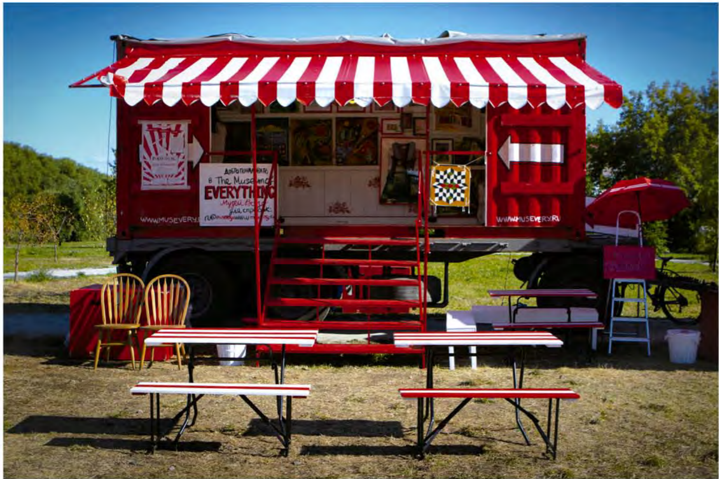
• 为了方便行走，MoE 整个俄罗斯之旅都开一辆大篷车，既是招揽隐世艺术家的场所，也是展览的场地