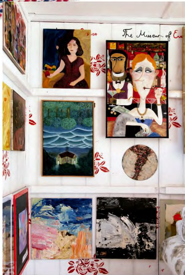
5-6. 大篷车的内部 7. 大篷车背部 8. MoE 2012 年在巴黎的展览